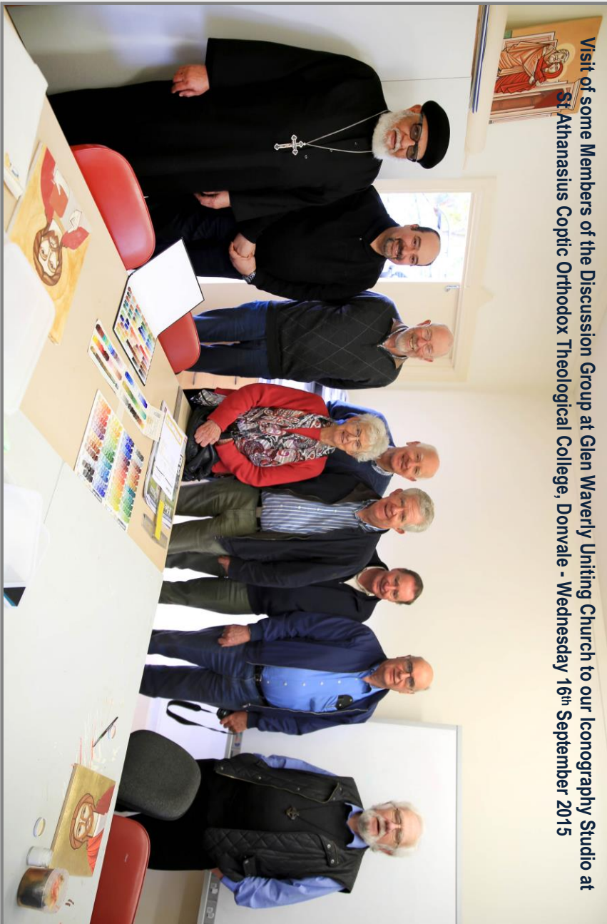
Visit of some Members of the Discussion Group at Glen Waverly Uniting Church to our Iconography Studio at St Athanasius Coptic Orthodox Theological College, Donvale - Wednesday 16 th September 2015